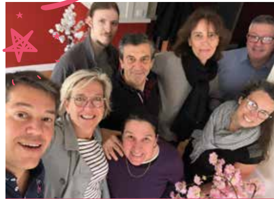
Merci aux bénévoles pour la mise en place

Pour l'an prochain, la date est déjà réservée, Dimanche 4 février 2024 !