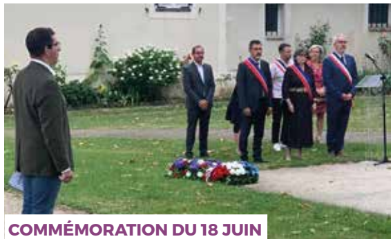
COMMÉMORATION DU 18 JUIN