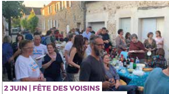
2 JUIN | FÊTE DES VOISINS A L'INITIATIVE DE L'ASSOCIATION AAB POUR LA RUE DE LA CROIX