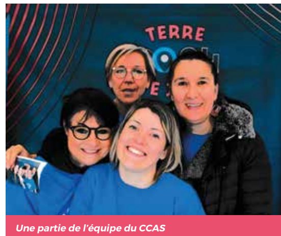
Une partie de l'équipe du CCAS