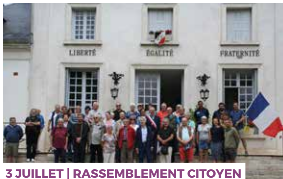
3 JUILLET | RASSEMBLEMENT CITOYEN (Suite à un appel lancé par l'association des Maires de France)