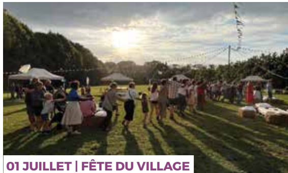
01 JUILLET | FÊTE DU VILLAGE